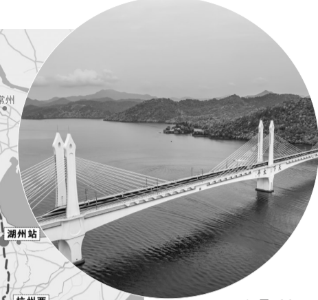
▲4月26日,两列复兴号智能动车组列车驶过池黄高铁太平湖特大桥

池黄高铁在池州站与南京至安庆高铁连接,在黟县东站与杭州至南昌高铁连接,串联起九华山、黄山风景名胜区等一批全国著名旅游名胜,将进一步完善区域路网结构,便利沿线人民群众出行,促进旅游资源开发和产业发展,对助力长江经济带建设和长三角一体化发展,具有十分重要的意义。