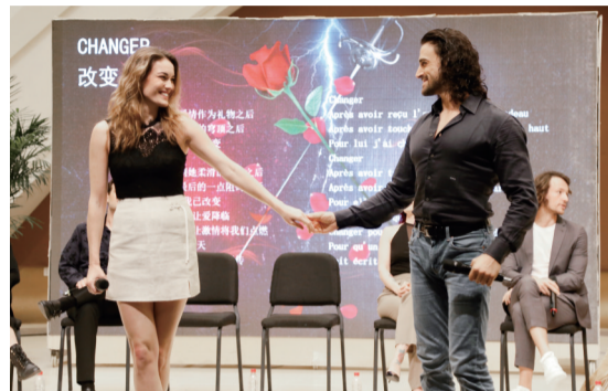
主创见面会现场

作为“2024·南京音乐节”重磅演出，4月25日—28日，法语原版音乐剧《唐璜》将在南京保利大剧院连演5场，用法兰西的浪漫与西班牙的热情，带领观众感受法语音乐剧必看经典的魅力。