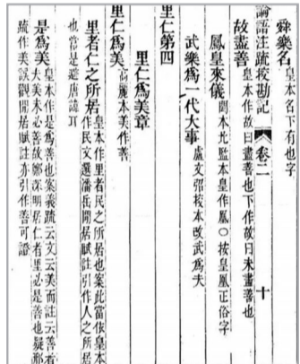
《江苏文库·文献编》之《十三经注疏校勘记》提到《里仁篇》