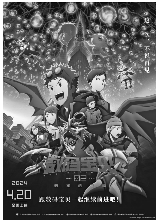
《数码宝贝02：最初的召唤》官方海报

电影《数码宝贝02》讲述了2012年2月，东京铁塔上空出现了巨大的数码蛋。就在本宫大辅(20岁)和V仔兽修行拉面技艺的时候，遇到了虽然拿着有裂纹的数码器，但身边没有搭档数码兽的迷之青年——自称“我没有数码兽，我的搭档数码兽被我杀了，我是世界上最初和数码兽建立搭档关系的人类”。