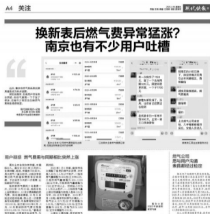
现代快报此前报道

现代快报讯(记者 孙玉春)近期重庆、成都等地相继有大量用户反映燃气表换表后费用猛涨等问题,引发广泛关注。现代快报针对南京地区用户的反映也做了报道,有不少人怀疑燃气费用异常,并且已经有用户决定将燃气表送检。针对部分用户的反映,4月21日中午,南京港华燃气有限公司在公众号上发布了“告客户书”。