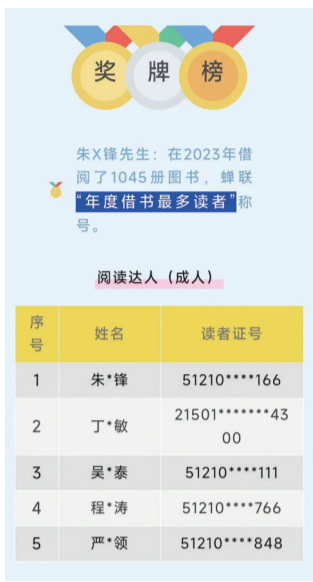
苏州图书馆“阅读达人”奖牌榜