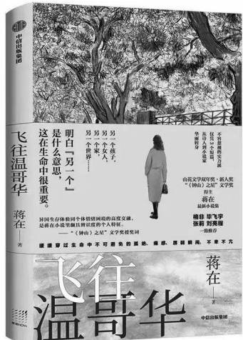
《飞往温哥华》 蒋在 中信出版集团 2023年4月

异域性写作，这是青年作家蒋在小说中的标识。它是如此的鲜明与强烈，仿佛成为了蒋在身上唯一的标签，以至于她不得不在《飞往温哥华》的后记中，发出告别的宣言：“飞往温哥华，看上去是开始，其实是一种结束。这个书名的恰切，如同一段时间的标识——它意味着某段异域性写作生涯的终结。”