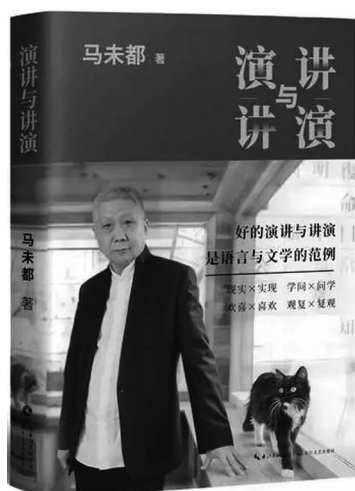
《演讲与讲演》 马未都 长江文艺出版社 2023年12月

马未都在一次演讲中，曾讲过一个故事：多年前故宫有件文物盘子碎了，这是一件国家一级文物宋代哥窑代表作品——青釉葵瓣口盘，这盘子在进行无损分析测试时发生损坏事故。在专业的工作人员手里损坏了一件重要文物，这事后来被网友扒了出来，引发了人们对文物保护的讨论。