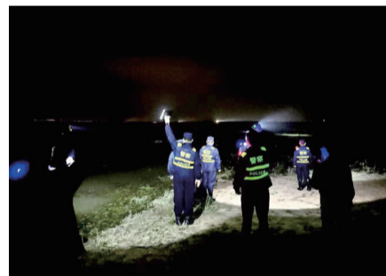
强光手电筒光束指引救援