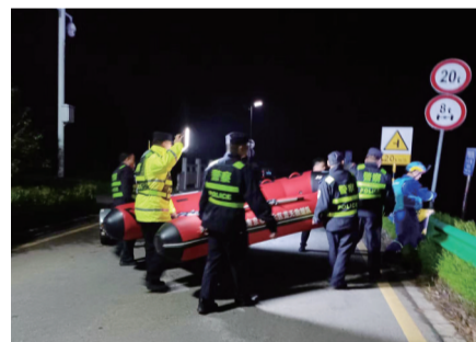
民警将救援艇运送到岸边