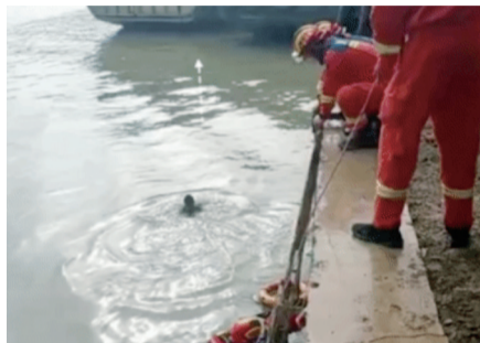
“跑船哥”和消防员一起将落水女子救上岸