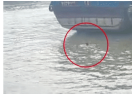
救人后“跑船哥”游回运输船

总有那么一些人,在他人遇到困难时会毫不犹豫地出手帮助,事后默默离开。4月2日,一位山东口音的“跑船哥”救起落水女子后悄然离开。4月11日,常州警方发布“寻人启事”,全网寻找这位“跑船哥”,要为他颁发见义勇为奖。