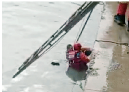
“跑船哥”拽住落水女子