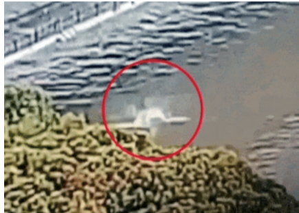
女子从阳湖大桥上跳河