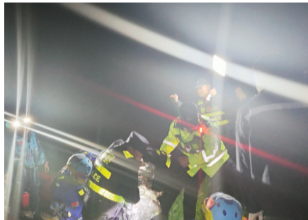
民警会同蓝天救援队员将男子转移到安全地带

一名男子跳湖轻生,为指引救援橡皮艇迅速准确地找到他,10名民警和辅警各举一盏强光手电筒站在石臼湖大桥上,另外9名民警、辅警举着9盏强光手电筒在岸边,为救援人员指引位置……近日,南京市溧水区一名男子跳湖轻生,溧水警方高效联动开展救援。在众人努力下,轻生男子被营救上岸,最终男子转危为安。