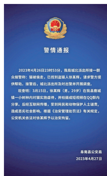
警方通报“杰克辣条”虐猫处理情况

2020年12月,有网友爆料,浙江警察学院一教师虐杀动物。网友称,涉事教师还表示自己半年虐杀了300多只,并称争取虐杀更多。2021年1月,浙江警察学院发布微博通报称,经调查,当事教师的不当行为违背公序良俗,造成不良社会影响,决定对其给予政务记大过处分,并调离教师岗位。