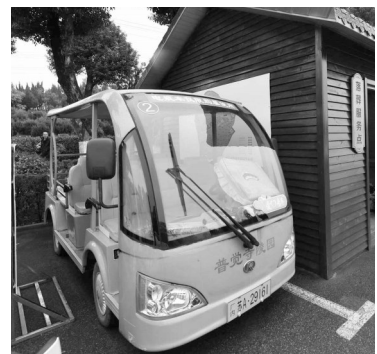
陵园的爱心接驳车