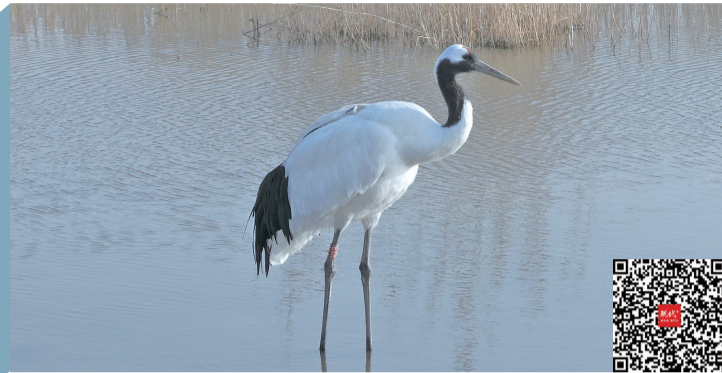
在山东东营短暂停留的“壮壮”