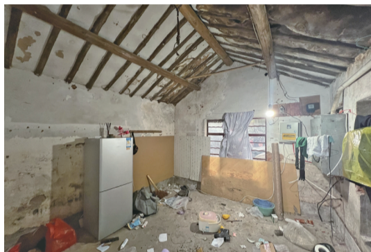
小房间内杂乱无章