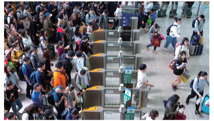
铁路南京站 段利雷供图

现代快报讯(记者 刘伟娟)现代快报记者从铁路南京站获悉,2024年清明小长假运输自4月3日起至4月7日止,共计5天。铁路南京站预计发送旅客161万人次(日均发送旅客32.2万人次),较2019年同期增长7.9%。