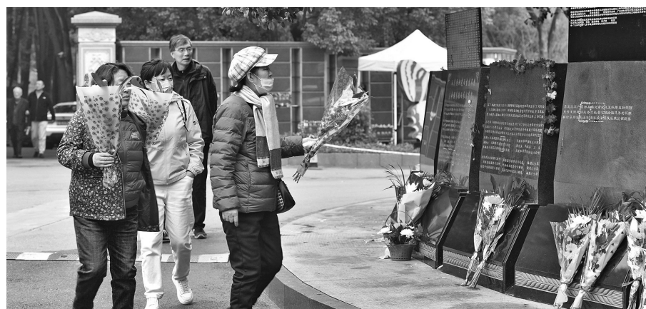
功德园小型生态墓赢得市民认可

雨花功德园经过20年的推广，目前接受生态葬的人越来越多。绿色节地安葬，文明祭扫随行。按照往年惯例，清明期间，该陵园每天都能销售多个生态墓，其中小型生态墓的销售占绝大多数。