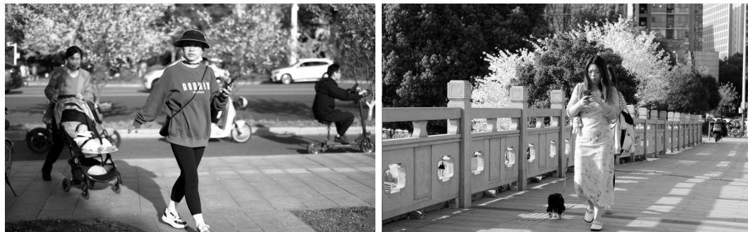
昨天南京气温一路攀升,行人脱掉了厚重的冬衣

现代快报讯(记者 徐红艳)虽然江苏刚刚整体打包进入春天,但气温却像是坐上了火箭,一路攀升。3月29日江苏最高温29.6℃,出现在高淳和溧阳,这一气温也创下了今年以来新高。未来三天好天气仍是主角,周日部分地区偶有小阵雨来扰,初夏“体验”也将继续生效。