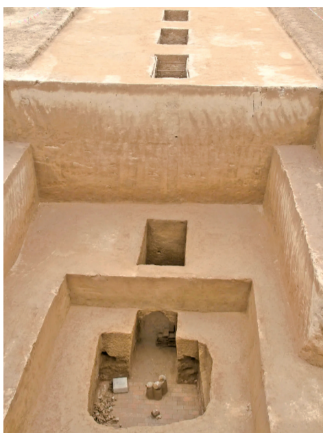
宇文邕墓葬发掘现场

头戴帝冕、清瘦英武、不怒自威——复旦大学科技考古研究院携手陕西省考古研究院28日正式公布北周武帝宇文邕的头像“复原图”及相关考古成果。这是我国首次以科技考古方式复原古代帝王容貌，赋予历史以鲜活气息。