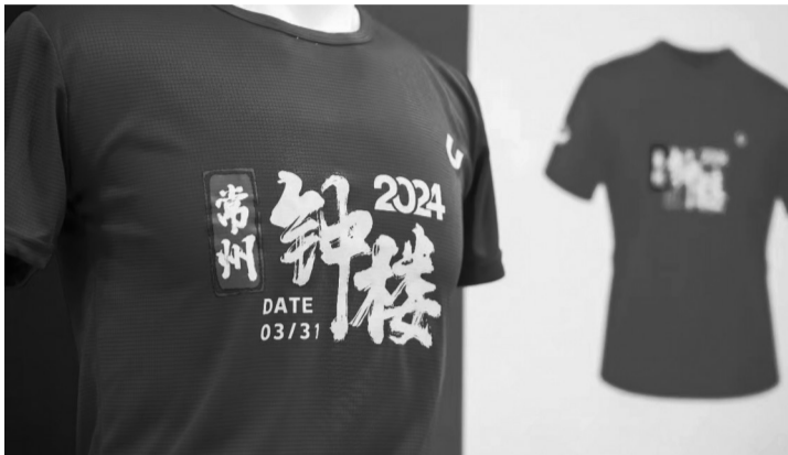
参赛服装

赛事奖牌设计独特,以钟楼地标建筑——“未来属于我”为设计元素,融入了老城厢、篦箕巷、明城墙等