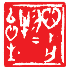
心外无物物以心生 3.2×3.1cm