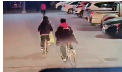
孩子骑自行车给消防员带路

现代快报讯(通讯员 陈虎 记者 李子璇)日前,淮安3名男孩发现火情后,冷静用电话手表报警,并一路狂蹬自行车给消防员带路。3月22日,淮安市见义勇为基金会、淮阴区见义勇为基金会共同前往三名男孩所在的学校,为他们送去“平安淮安”建设奖励和礼物。