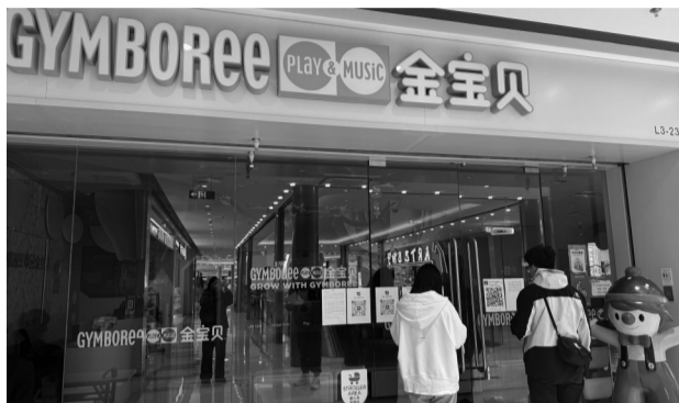
金宝贝华采天地中心店

据悉,金宝贝成立于1976年,2003年正式进入中国。金宝贝官网显示,目前已有400多家加盟中心,遍布全国近150个城市。各中心独立经营,与品牌方为特许经营法律关系。