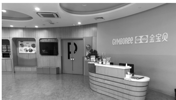
金宝贝南京江宁景枫中心店