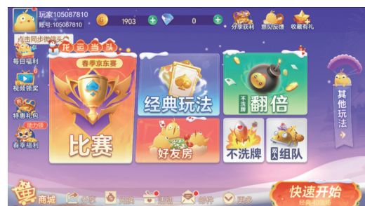
边锋掇蛋玩法多样,赛事丰富