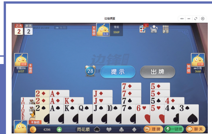
边锋掇蛋游戏中还未“一键理”的牌型

近年来,顺应掇蛋产业的发展,线上游戏平台相继建立,各种掇蛋游戏如雨后春笋不断涌现,边锋掇蛋、微乐掇蛋、咪咕掇蛋、天天爱掇蛋、多乐掇蛋等多款拳头产品,聚焦掇蛋玩法创新与线上生态建设,为线上玩家创造了更为丰富多元的游玩体验。