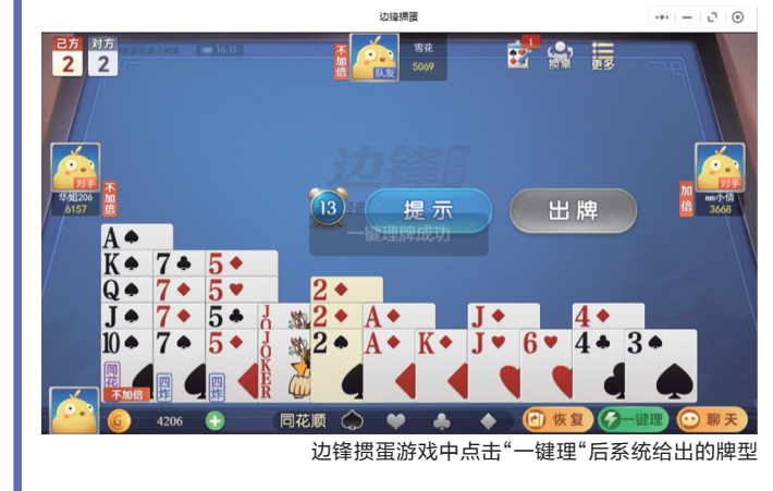
边锋掇蛋游戏中点击“一键理”后系统给出的牌型