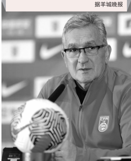
伊万科维奇在媒体见面会上