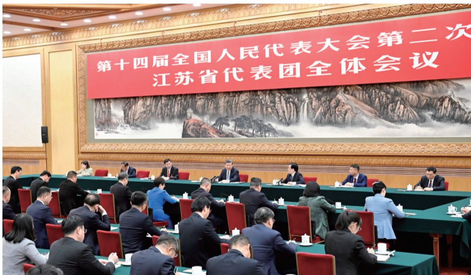
3月5日，中共中央总书记、国家主席、中央军委主席习近平参加他所在的十四届全国人大二次会议江苏代表团审议

新华社北京3月5日电 中共中央总书记、国家主席、中央军委主席习近平5日下午在参加他所在的十四届全国人大二次会议江苏代表团审议时强调，要牢牢把握高质量发展这个首要任务，因地制宜发展新质生产力。面对新一轮科技革命和产业变革，我们必须抢抓机遇，加大创新力度，培育壮大新兴产业，超前布局建设未来产业，完善现代化产业体系。发展新质生产力不是忽视、放弃传统产业，要防止一哄而上、泡沫化，也不要搞一种模式。各地要坚持从实际出发，先立后破、因地制宜、分类指导，根据本地的资源禀赋、产业基础、科研条件等，有选择地推动新产业、新模式、新动能发展，用新技术改造提升传统产业，积极促进产业高端化、智能化、绿色化。 江苏代表团审议热烈，气氛活跃。崔铁军、高纪凡、宋燕、吴惠芳、吴新明、孙景南等6位代表分别就实现高水平科技