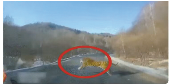
东北虎横穿公路瞬间

2月7日上午,吉林省汪清县罗子沟镇一名居民在驾车途中,突然遇到一只野生东北虎横穿公路,险些与车辆发生碰撞。