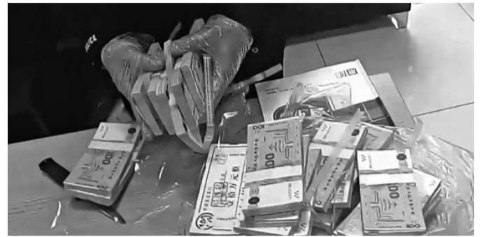
保洁大爷捡到的点钞练功券

现代快报讯(记者 高达)“警察同志，我们的保洁员捡到了30万元现金！”日前，苏州太仓市公安局港区派出所接到辖区一小区物业经理顾先生来电报警，称物业一名保洁员捡到了30万元现金巨款。民警迅速赶到物业办公室，只见桌上放着三摞被包装得整整齐齐的“万元巨款”。从外表看，确实与从银行取出来的现金相差无几。