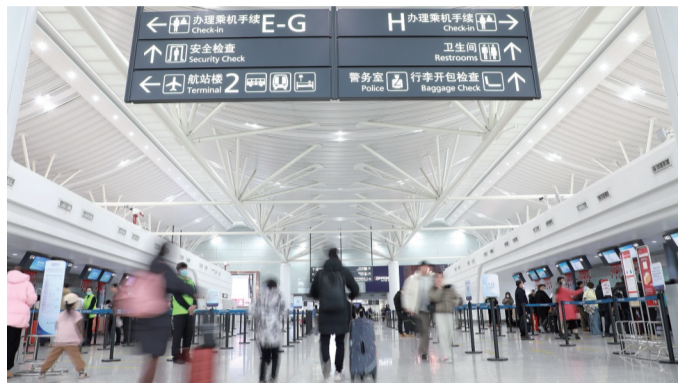
春节临近,南京禄口机场旅客们踏上回家路