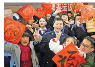
车厢内欢乐多

现代快报讯(通讯员 张鑫 记者 顾元森)为方便在上海、昆山、苏州、无锡等长三角地区的务工人员能够及时返乡,2月4日,返乡专列G9284次列车满载着返乡人员从上海站发出。