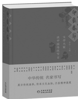
《印象春节：文学大家谈中国传统节日》 李浩主编 贵州人民出版社 2023年12月

瑞兔辞旧岁，祥龙迎新春。细啜清茶，悠然翻开案头上的这本《印象春节：文学大家谈中国传统节日》(贵州人民出版社2024年1月出版)，宛如推开了一扇亮丽的窗口，那年、那人、那事纷至沓来，寄寓着别样的文化情怀，从众多文学大家的倾情书写中，热切展现着传统节日——春节的亘古魅力。