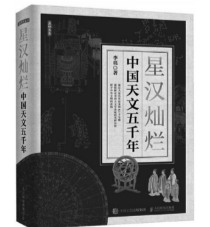
《星汉灿烂：中国天文五千年》 李亮著 人民邮电出版社 2024年1月

讲到天文学，大众读者通常只以为它就是科技史，而忽视了中国天文学内蕴丰富的传统文化因素，特别是与政治文明的关系。