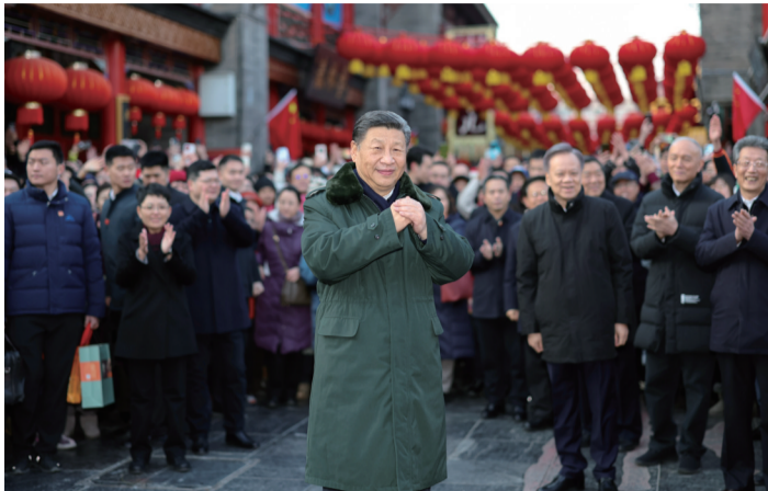
2月1日下午,习近平在天津古文化街考察时,向全国各族人民和香港同胞、澳门同胞、台湾同胞、海外侨胞致以美好的新春祝福

离开村子时,村民们纷纷围拢过来向总书记问好。习近平频频向大家挥手致意,亲切地对乡亲们说,看到大家生产生活已经基本恢复,温暖过冬有保障,感到很高兴。去年以来,我国其他一些地方也遭受