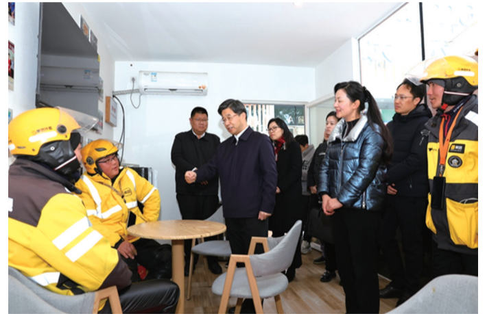
工会领导在“井小驿”户外劳动者基地慰问外卖骑手

近日,常州市总工会走访慰问困难劳模、困难职工、建筑工地农民工、新就业形态劳动者和常州市总机关离退休干部。