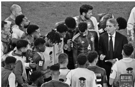
曼奇尼在点球大战前布置战术