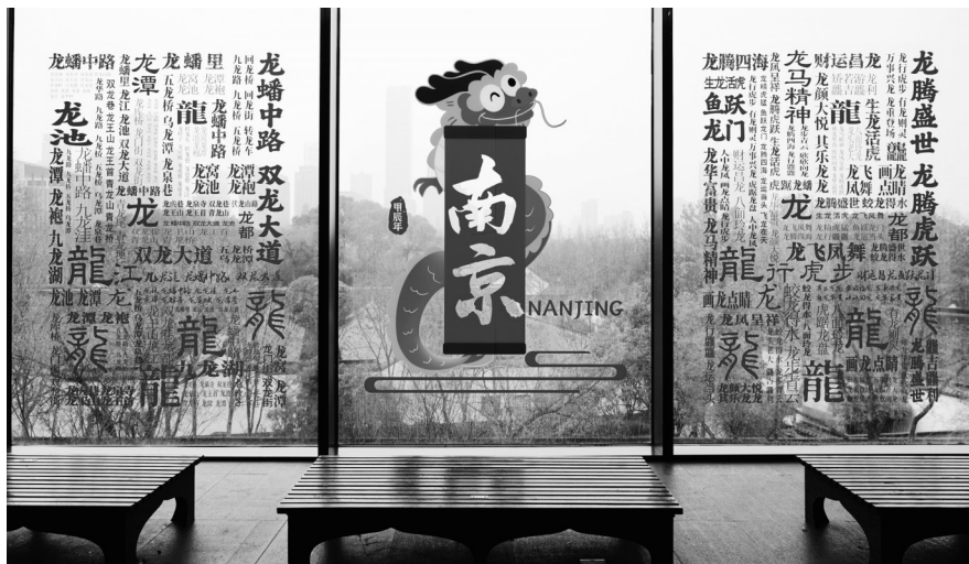
六朝博物馆落地窗

最火的要数悦动新门西产业园的这面网红墙了,灰色的墙上写着苍劲有力的“南京”二字,阳光正好时,墙面上会出现斑驳的树影,别有韵味。自2023年12月中旬这面网红墙出圈以来,每天都有络绎不绝的拍照大军前来打卡。附近咖啡店的店员说:“自从有了这面墙,咖啡店生意都变好了。”近日,园区又制作了一面新墙——写上了“金陵”二字,很多游客拍完“南京”拍“金陵”,刷屏朋友圈。