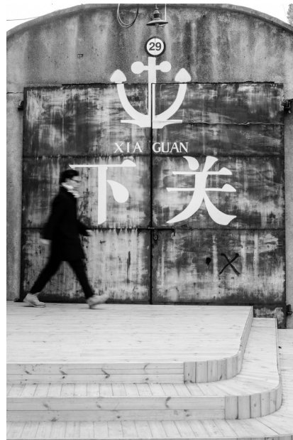
最复古的“下关”墙