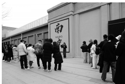
游客排队打卡悦动新门西产业园“南京”墙