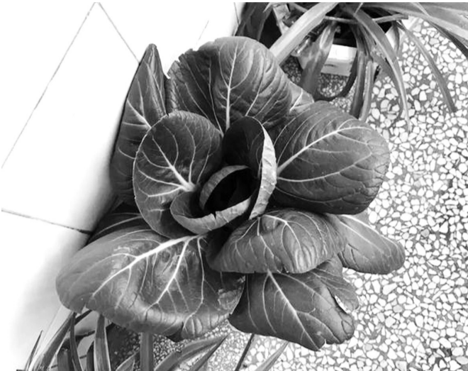
刚带到学校时青菜的样子