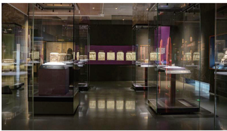
《大唐宝藏——法门寺地宫文物精粹展》