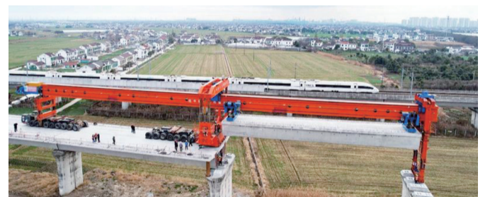
施工现场

现代快报讯(通讯员 余剑波 记者 刘伟娟)1月23日，现代快报记者从中国铁路上海局集团有限公司获悉，近日在盐通高铁南通至张家港段(以下简称“通张段”)施工现场，随着第一榀500吨箱梁稳稳地落在沪苏通长江公铁大桥南引桥桥墩上，标志着该区段174榀单线梁开始架设，为后续施工打下坚实基础。