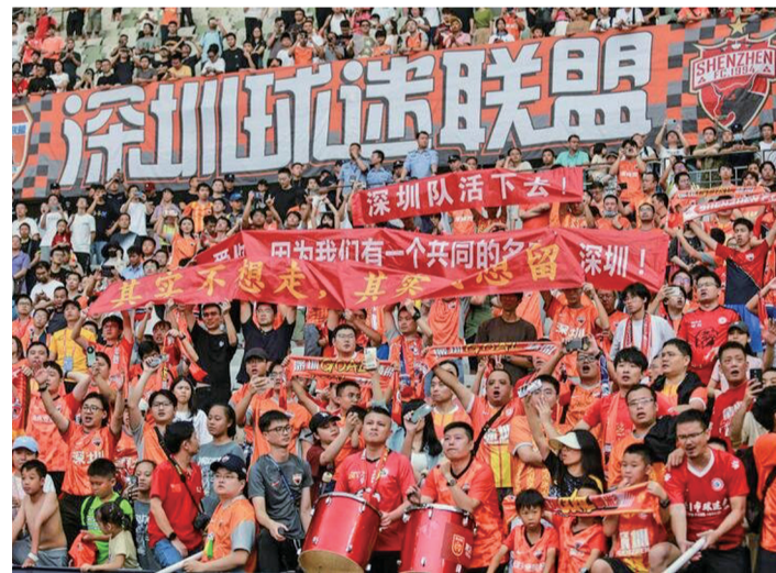
深圳队球迷

同的道路。不过比起这两支球队,曾经的中超“八冠王”广州队的情况就比较复杂了。在1月17日中国足协发布的《中国足球协会关于公示2024赛季职业联赛准入第二批完成债务清欠俱乐部名单的通知》,广州队位列其中,这意味着广州队通过了中国足协的准入审查。