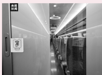
▲静音车厢内的标识和手册 视频截图