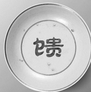
大地馈赠 拒绝浪费