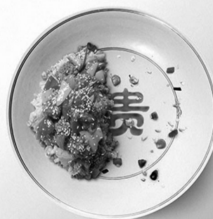
俭以养德 杜绝浪费