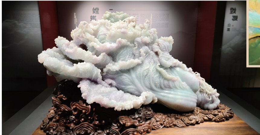
非遗珍宝馆镇馆之宝《螳螂白菜》