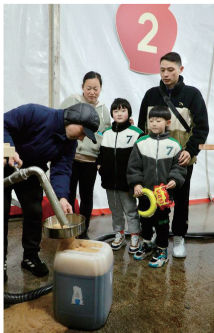
王先生一家从浙江赶来打酱油

“不打酱油不过年，打了酱油过好年。”春节前到恒顺打酱油是镇江人特有的年俗，已有47年历史。今年，因疫情线下已经三年没打的酱油重启。1月20日，提着大壶小壶排队打酱油的市民络绎不绝。其中浙江一家四口更是一大早7点就从家里出发，特意开车赶来，提着两大壶打了100斤。据介绍，今年主办方储备了300吨酱油。