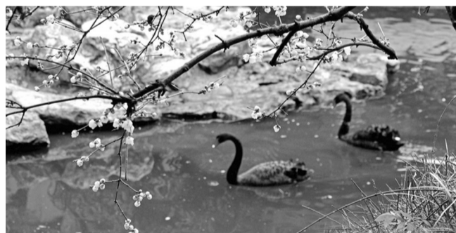
南京瞻园的黑天鹅