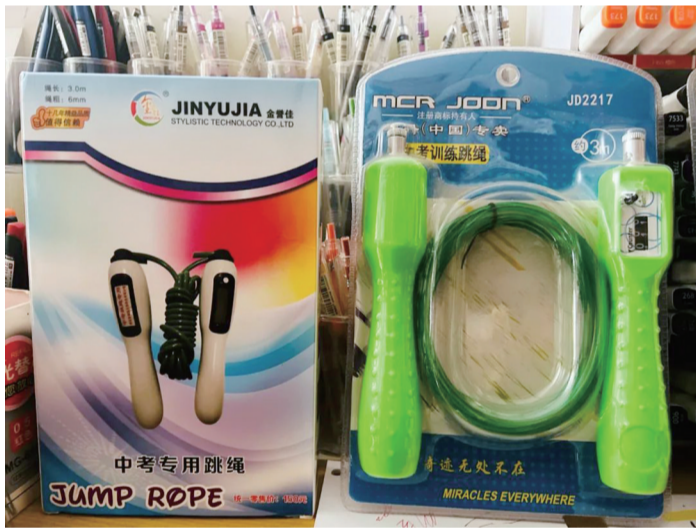
安徽省六安市金安区一家文具店内的跳绳