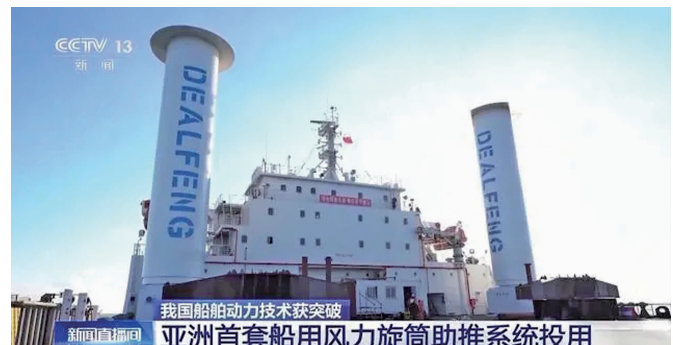
这两个安装在船上的大圆筒,就是旋筒风帆系统

1月9日,中国海油发布消息,我国自主研发制造的亚洲首套船用风力旋筒助推系统正式投入应用,这不仅标志着我国在商用船舶旋筒风帆实现了零的突破,也为推动船舶运输行业绿色低碳发展带来积极示范意义。