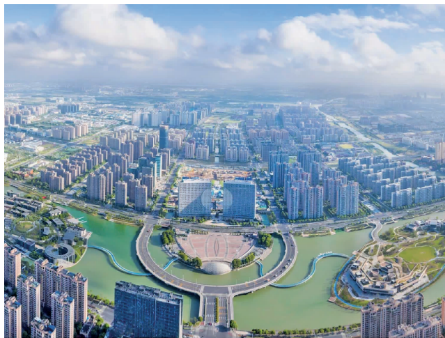
活力元和

元和塘、华元路、安元路……走在苏州相城,随处可见与“元”相关的地名和道路。何以“元”?它的背后,缘起一条元和塘。作为相城文化活地标,元和塘见证了千年的历史变迁。在元和塘的悉心孕育下,苏州市相城高新区(元和街道)(以下简称“元和”)带着深厚的人文底蕴走来,在汲古铸今中织好文化经济“双面绣”,成长为一座元气满满的活力新城。