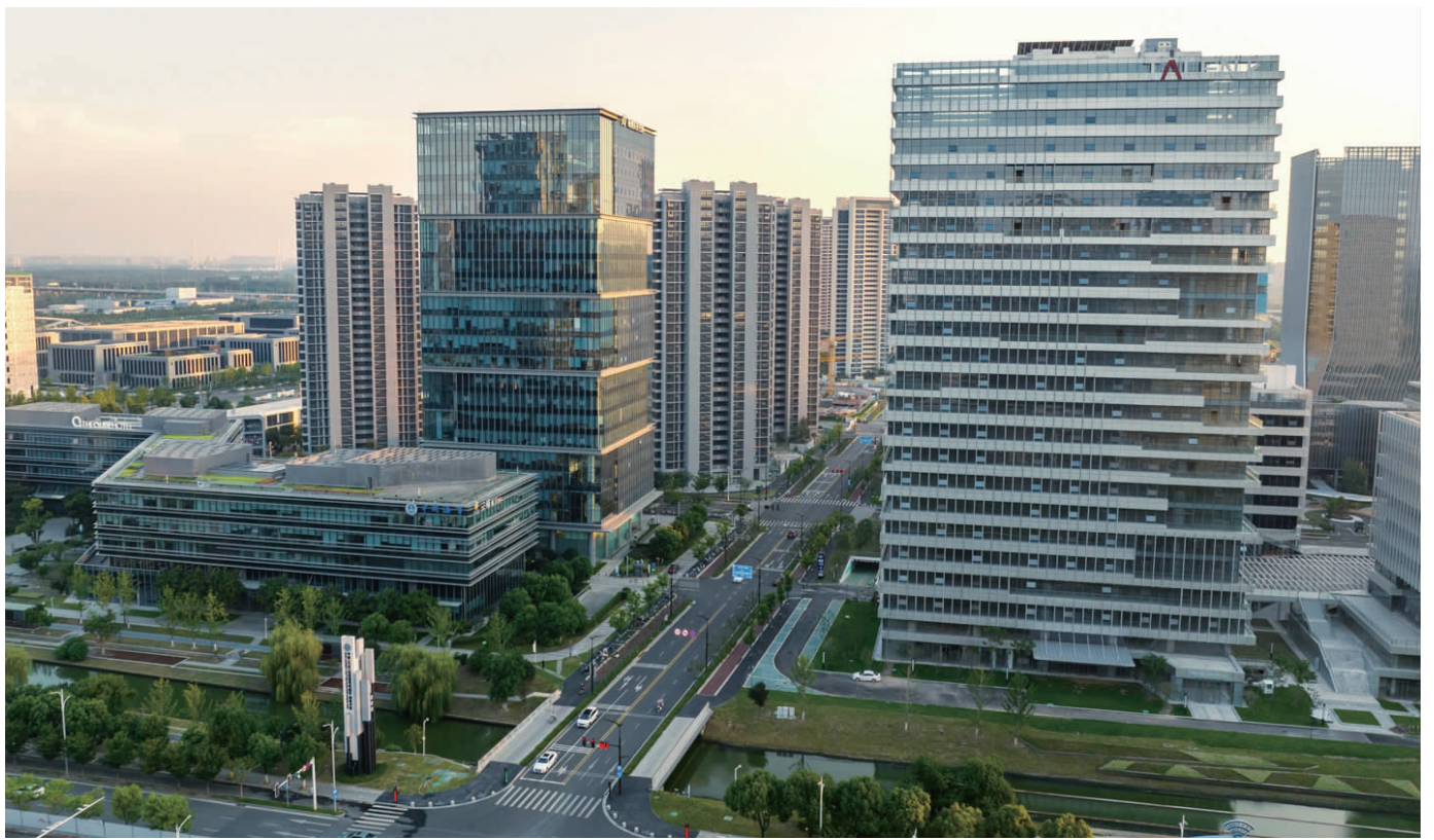
南京江北新区研创园一角