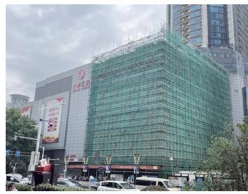
此前大洋百货搭起围挡