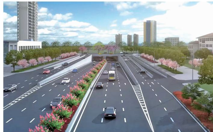
凤集大道效果图 南京建设公众号

凤集大道西起快速路滨江大道，东至新湖大道，全长约4.5千米，是连接开发区与古雄街道北部的东西向重要通道。现状凤集大道宁芜铁路西侧开发路段已建成，长度约3.5千米。本次启动建设的隧道段起于雨花经济开发区龙飞路以东，向东以桥梁形式上跨板桥河后，依次下穿宁芜公路及宁芜铁路后与新林大道平交，全长约900米。在施工围