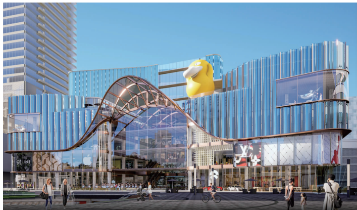
中央商场建成效果图

新街口年代最久的商场是中央商场，始建于1936年，当年作为新街口第一家大型百货商场开门迎客，如今已有88岁。