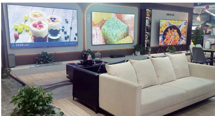
商场售卖的电视机

相比于大屏超薄的电视,小而便携的屏幕更畅销。中国信通院发布的国内手机市场运行分析报告指出,2023年11月,国内市场手机出货量3121.1万部,同比增长34.3%,其中,