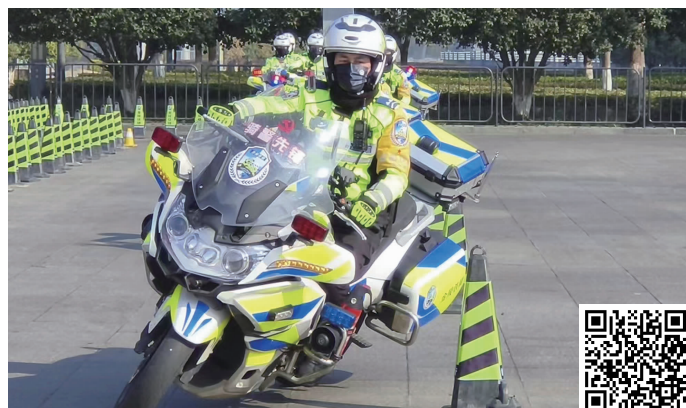
铁骑训练现场 扫码看视频

据悉,在过去的一年里,南京交警机动大队铁骑中队全体队员总巡逻里程达130余万公里,快速处置城市快速路交通事故、抛锚警情1.7万余起,平均到达时间约3.5分钟。如果没有绕弯、钻缝、急停急起以及团队配合等娴熟技能,就难以实现“最快双腿”