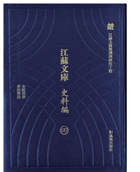
《客座赘语》 [明]顾起元撰 凤凰出版社