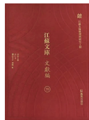
《毛诗名物图说》 [清]徐鼎辑 凤凰出版社