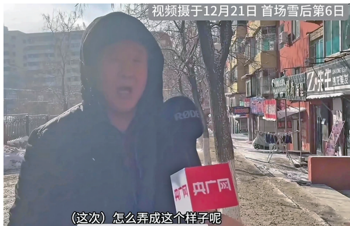
视频摄于12月21日 首场雪后第6日

随后,记者又来到本溪市第十二中学城建校区、本溪市明山区实验小学,以及本溪高中等地进行了实地走访,发现这些校园周边的小街巷很多还未进行路面清雪,有的