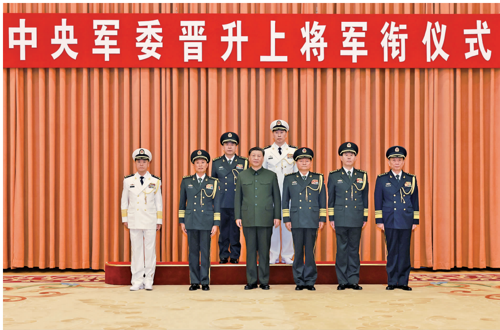
习近平等领导同志同晋升上将军衔的军官合影