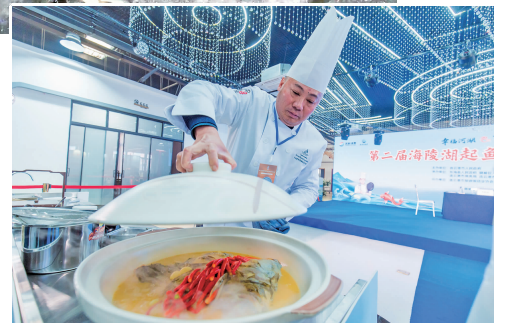
►厨师烹制海陵湖大鱼