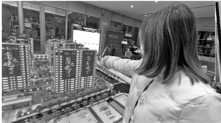
消费者购买楼盘的沙盘