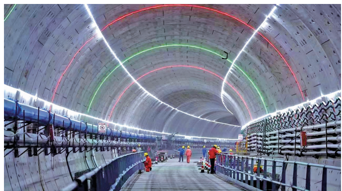
盾构隧道双线顺利贯通

南京建宁西路过江通道是“十四五”期间南京城市发展重大工程项目。项目位于长江大桥和扬子江隧道之间,距离上游扬子江隧道约1.8公里,距离下游长江大桥约2.4公里,是连接主城鼓楼区与江北新区核心区的重要纽带,全长约6.8公里,其中隧道段长约3.55公里,穿越长江段采用盾构法施工,盾构段长约2362米。全线与江北大道、横江大道、惠民路交叉