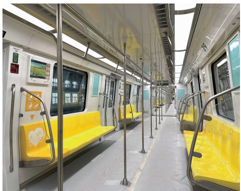
5号线列车及内部

快报讯(记者 刘伟娟)12月19日,南京地铁5号线南段开始不载客试运行。现代快报记者获悉,对5号线南段的运营组织管理和设施设备系统的可用性和可靠性进行检验,向初期运营迈出坚实的一步。