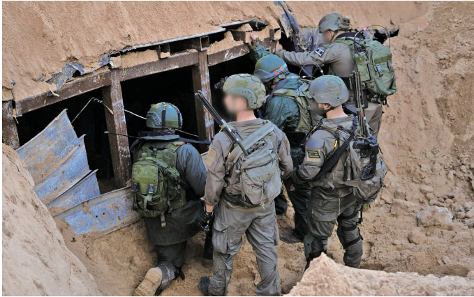
以色列国防军12月17日发布的照片显示,以军地面部队在加沙地带发现一处大型地道